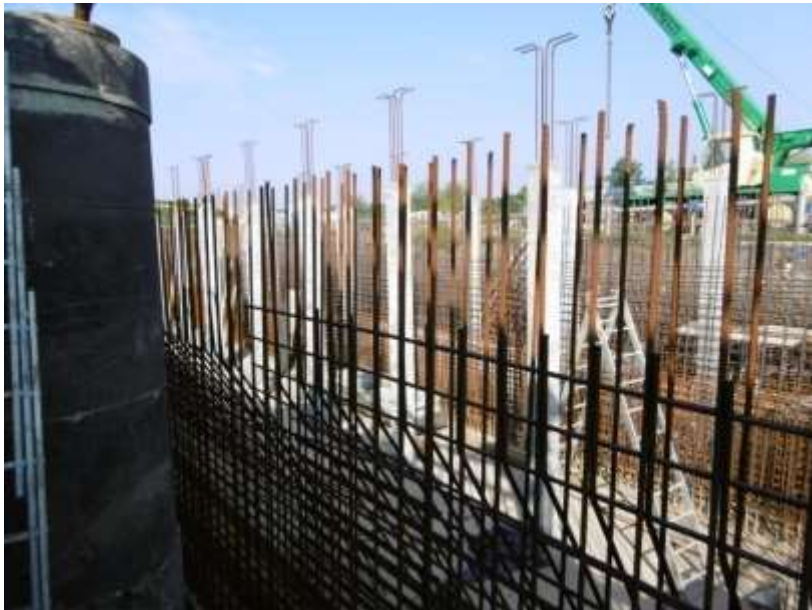
Fot.: Budowa piaskownika

Modernizacja Zakładu Oczyszczania Ścieków Płaszów – największego zakładu tego typu w południowej Polsce. W ramach projektu powstał nowy piaskownik i zmodernizowany został węzeł przeróbki osadów. Inwestycja zaowocowała maksymalizacją produkcji biogazu i optymalizacją procesu oczyszczania ścieków.