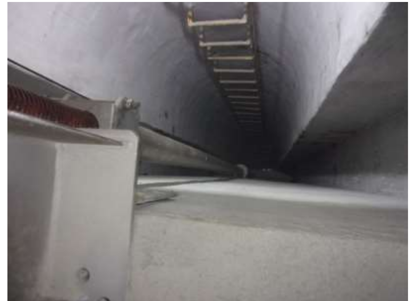
Fot.: Zejście pod Wisłę (syfon)