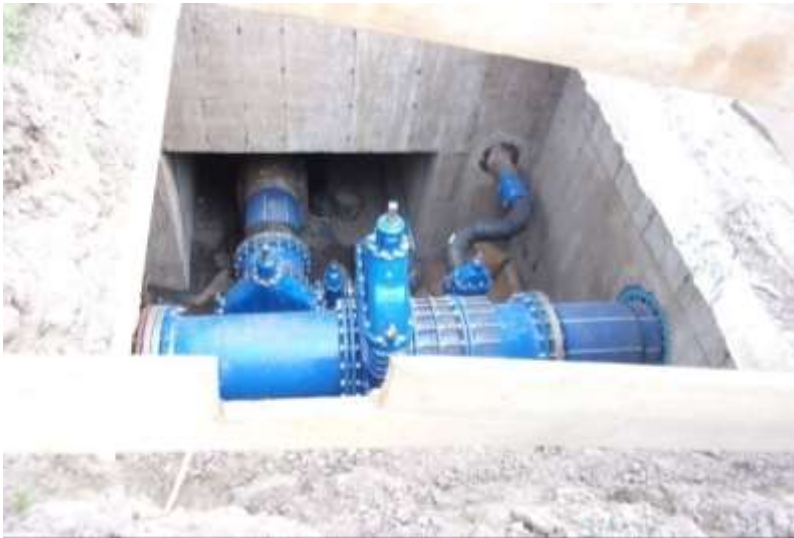
Fot.: Węzeł wodociągowy po modernizacji

Budowa, przebudowa i modernizacja sieci wodociągowej – prace obejmowały remont ponad 5 km sieci, przebudowę prawie 2 km i budowę ponad 3,5 km nowego rurociągu. Inwestycje wodociągowe prowadzone były na terenie Prądnika Czerwonego, Nowej Huty, oraz Swoszowic. Remonty rurociągów magistralnych przeprowadzone zostały na Prądniku Białym, Grzegórkach i w Bieńczykach.