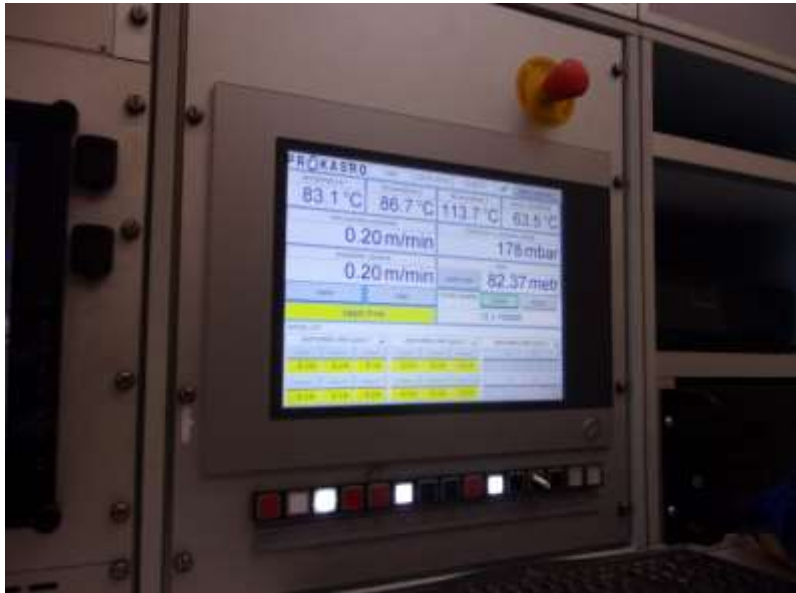
Fot.: Zarządzanie procesem renowacji

Rozbudowa inteligentnego systemu zarządzania sieciami – rozbudowa i zwiększenie funkcjonalności posiadanych modeli hydraulicznych sieci wod-kan i ich integracja z systemami GIS, SCADa, Billing oraz wdrożenie systemu do modelowania w trybie rzeczywistym.