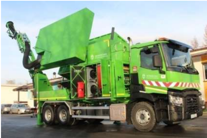
Fot.: Samochód specjalistyczny – koparka ssąca

Zakup czterech samochodów specjalistycznych – w celu utrzymania standardów i sprawności systemu kanalizacyjnego i wodociągowego Spółka nabyła cztery specjalistyczne samochody do prowadzenia prac konserwacyjnych sieci i obsługi przepompowni ścieków.