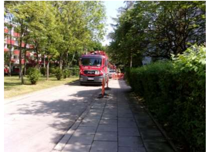
Fot.: Czyszczenie kanalizacji