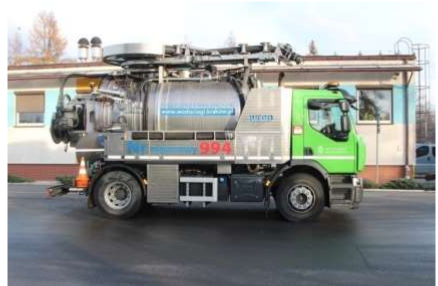
Fot.: Samochód specjalistyczny do obsługi przepompowni ścieków