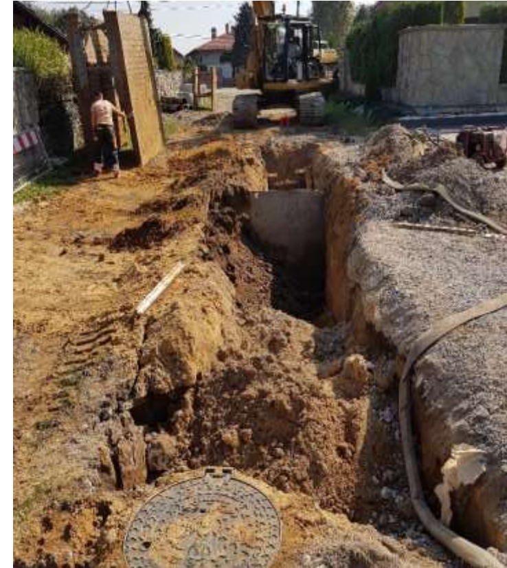
Fot.: Budowa kanalizacji sanitarnej ul. Łamana

Budowa 6 km nowych odcinków sieci kanalizacyjnej m.in. na osiedlu Piaski Wielkie (ul. Czajna i jej odgałęzienia, Obronna, Łamana, Rzącka, Przewiewna, przy Kuźni, Powąły z Taczewa, Zyndrama z Maszkowic, ks. Dźwigońskiego), w Płaszowie (ul. Myśliwska i Gumniska), oraz odcinki w Swoszowicach, Łagiewnikach i Czyżynach.