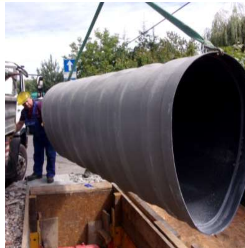
Fot.: Renowacja kanalizacji modułami GRP