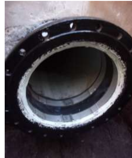
Fot.: Zmodernizowany element sieci wodociągowej