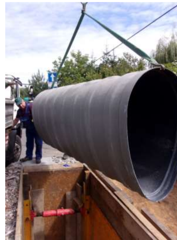
Fot.: Renowacja kanalizacji modułami GRP

Remont kanalizacji panelami GRP – kolektory al. Mickiewicza i Krasińskiego