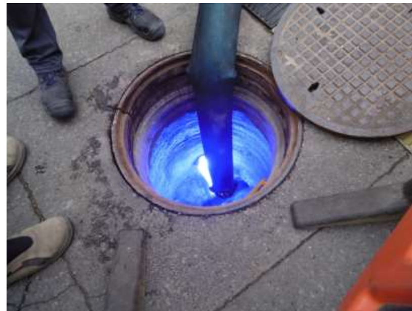
Fot.: Renowacja kanalizacji utwardzanie za pomocą rękawa