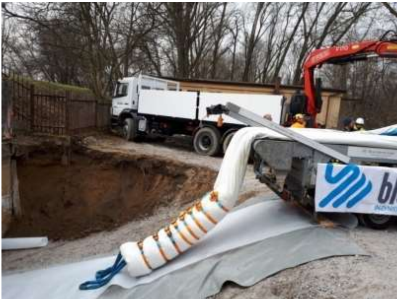
Fot.: Montaż rękawa w syfonie pod Wisłą

Syfon znajduje się pod korytem rzeki na wysokości stopnia wodnego Dąbie i łączy lewobrzeżną część zlewni kanalizacyjnej Krakowa z Zakładem Oczyszczania Ścieków Płaszów.