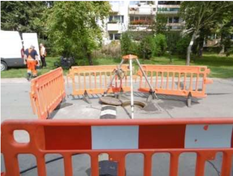
Fot.: Renowacja rękawem ul. Barbary

Remont 23 km kanalizacji sanitarnej i ogólnospławnej.